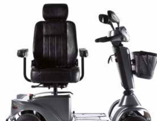
→ Możliwość obracania siedziska ułatwia przesiadanie się