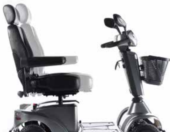
→ Bezstopniowa regulacja głębokości siedziska

Nowoczesne siedzisko S-SERIES zapewnia maksymalny komfort – od możliwości regulacji wysokości, głębokości i kąta nachylenia, po podnoszone podłokietniki z regulacją szerokości, kąta nachylenia i głębokości, każdy z elementów opracowano z myślą o wygodzie użytkownika.