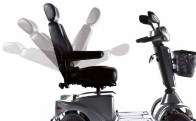
→ Szybka regulacja kąta nachylenia oparcia