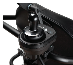
SE09 - Kontroler dla opiekuna