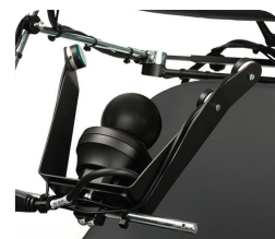
SE04 - Kontroler podbródkowy