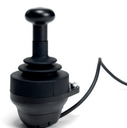
SE55 - Wzmocniony kontroler