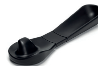
B66MAL - Podłokietnik dla hemiplegików