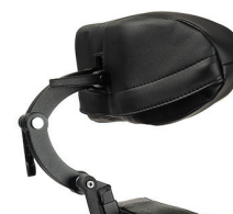
L58 - Regulowany, wstępnie ukształtowany załówek