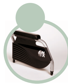
podłokietniki tylko B03.

EclipsX4 90° jest wózkiem aluminiowym stabilizującym głowę i plecy z oparciem odchylanym do poziomu. Oparcie reguluje się w sposób płynny przy pomocy sprężyn hydraulicznych. Ten model przeznaczony jest dla osób leżących, wymagających długoterminowej opieki, niestabilnych, dla osób starszych wymagających stałej opieki. Takie osoby nie zawsze kwalifikują się na szeroko rozumiany wózek inwalidzki, który ze względów funkcjonalnych dla takich chorych nie stanowi żadnego komfortu oraz bezpieczeństwa. Dla takich osób potrzebny jest sprzęt, który skutecznie spełni swoją rolę przede wszystkim z punktu widzenia zmiany pozycji oraz stabilizacji tułowia.