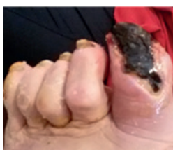
Dzień 0 – Wieczór