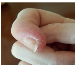
Po dwóch tygodniach