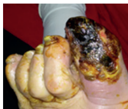
Dzień 0 – Rano