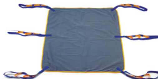
Tabela doboru temblaka