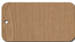
D9103 PR Jasny Dąb