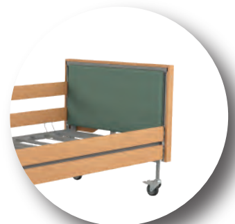
Szczyt tapicerowany kolor: VIENNA 14